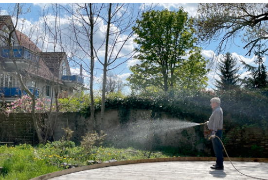
Unsere Garten AG in 2022